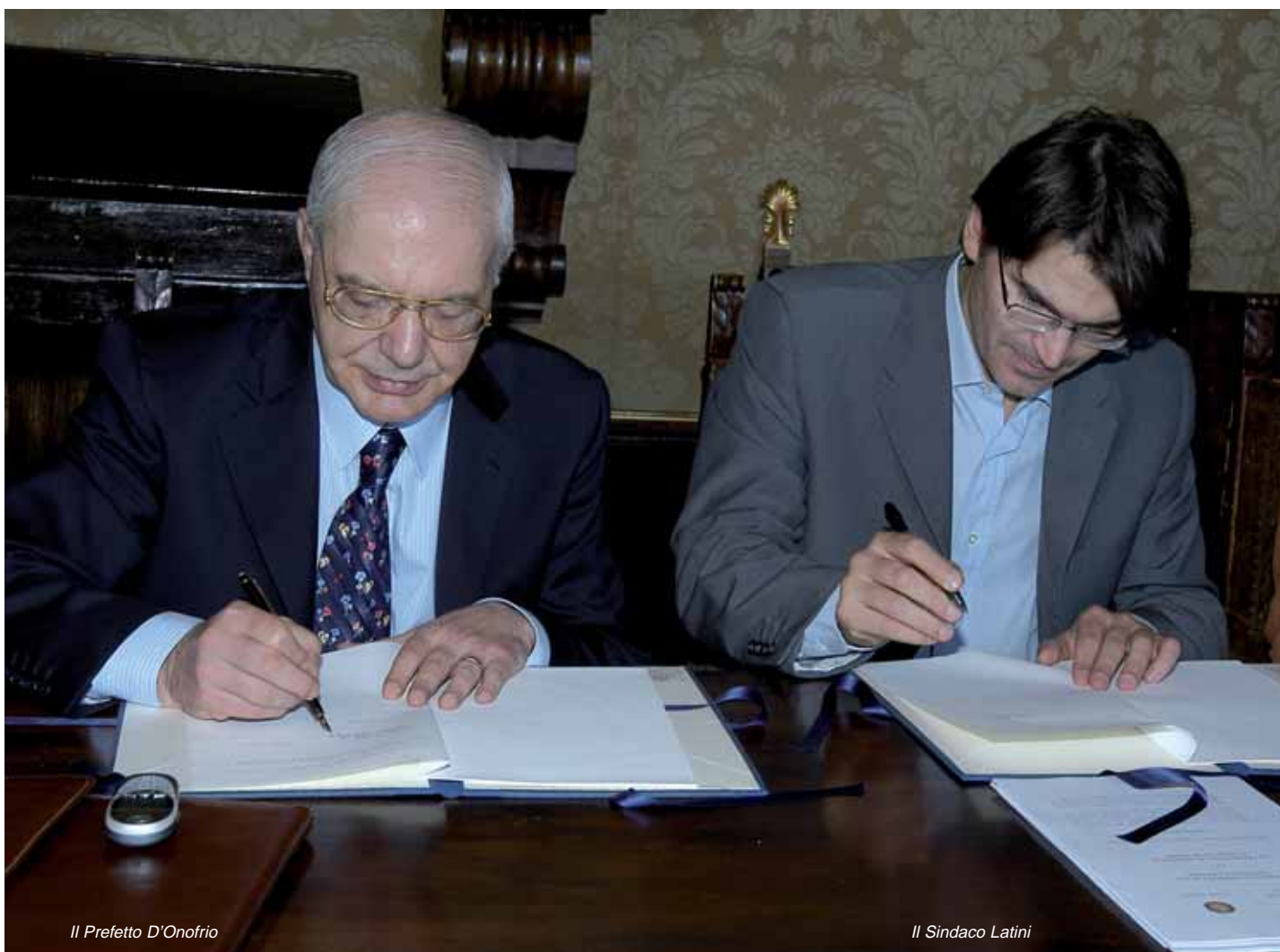
Il Prefetto D'Onofrio

prevenzione, per una migliore qualità di vita degli osimani. Grazie a questo protocollo è stato possibile avviare sul nostro territorio un nuovo lavoro di prevenzione dei fenomeni criminali, con particolare riguardo i settori degli appalti, delle autorizzazioni agli esercizi pubblici e commerciali, degli interventi urbanistici.