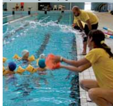
Piscina: boom di presenze pag. 26