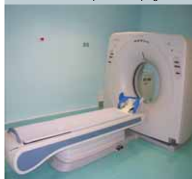
TAC: 6500 esami pag. 21