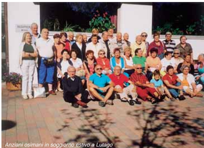
Anziani osimani in soggiorno estivo a Lutago

Per antica tradizione, Osimo è una città in cui la solidarietà viene coniugata a 360 gradi. Da sempre, questa particolare sensibilità è testimoniata dalla presenza attiva di molte associazioni di volontariato, capaci di mobilitare un gran numero di cittadini; ed è testimoniata anche dalle ben quattro case di riposo operanti sul territorio municipale.