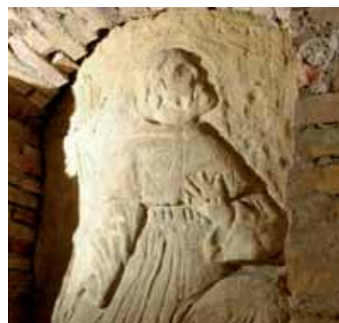
Aprono le grotte pag. 6-7

Aspettiamo una vostra e-mail: uffstampa@comune.osimo.an.it, o lettera: Comune di Osimo, P.zza del Comune, 1 - Osimo