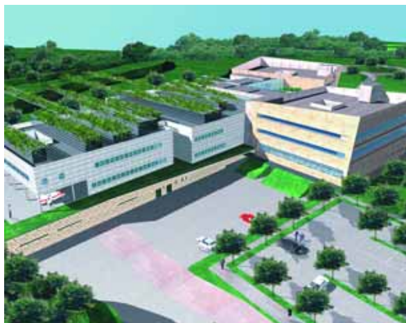
Illustrazione del nuovo ospedale di rete