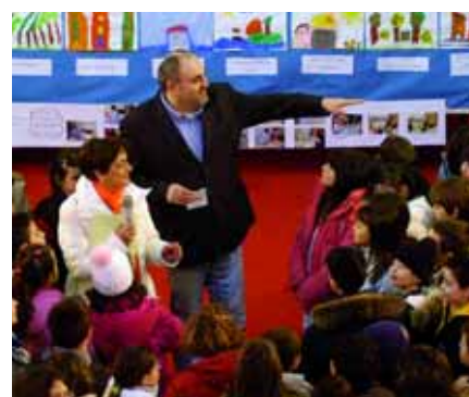
La città del libro pag. 13

La redazione invita tutti i cittadini ad inviare proposte, suggerimenti e denunce per rendere sempre più interessante il nostro servizio. Aspettiamo una vostra e-mail: uffstamp@comune.osimo.an.it, o lettera: Comune di Osimo, P.zza del Comune, 1 - Osimo