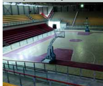
Pronto il Palazzetto dello Sport pag. 28