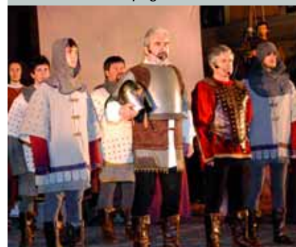
La Battaja del Porcu pag. 21