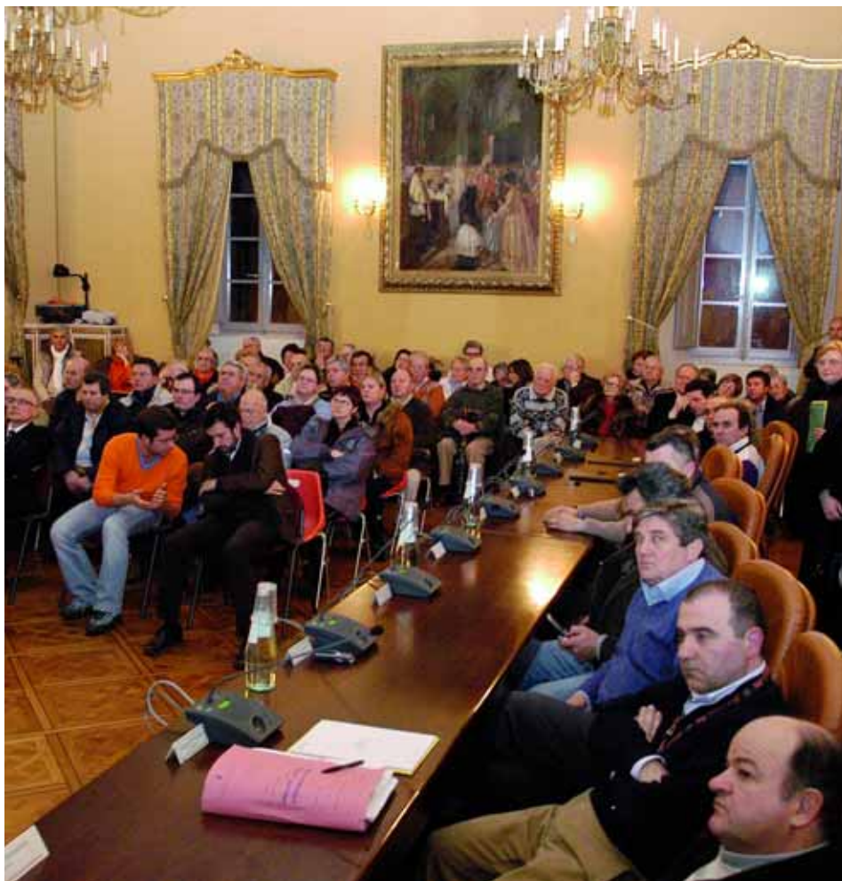
Il pubblico gremisce la Sala Gialla in occasione della presentazione del progetto definitivo dell'ospedale

Il Comune di Osimo ha vinto un importante round giudiziario con Codelsa, la concessionaria dei servizi per il primo cantiere dell'Ospedale di Rete di San Sabino. Il giudizio di arbitrato si è concluso con la corresponsione al Comune della somma di 884.000 euro.