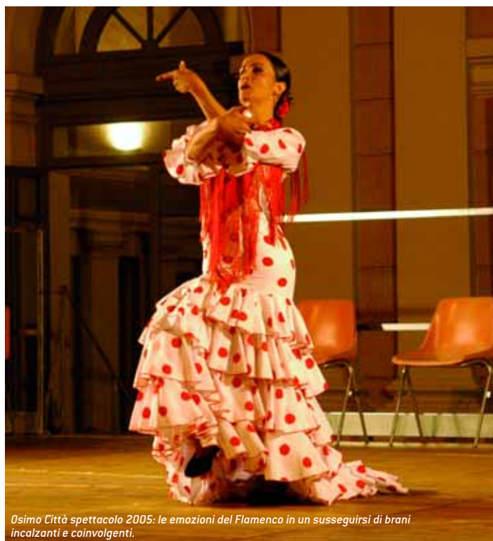
Osimo Città spettacolo 2005: le emozioni del Flamenco in un susseguirsi di brani incalzanti e coinvolgenti.