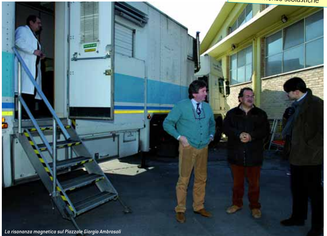
La risonanza magnetica sul Piazzale Giorgio Ambrasoli