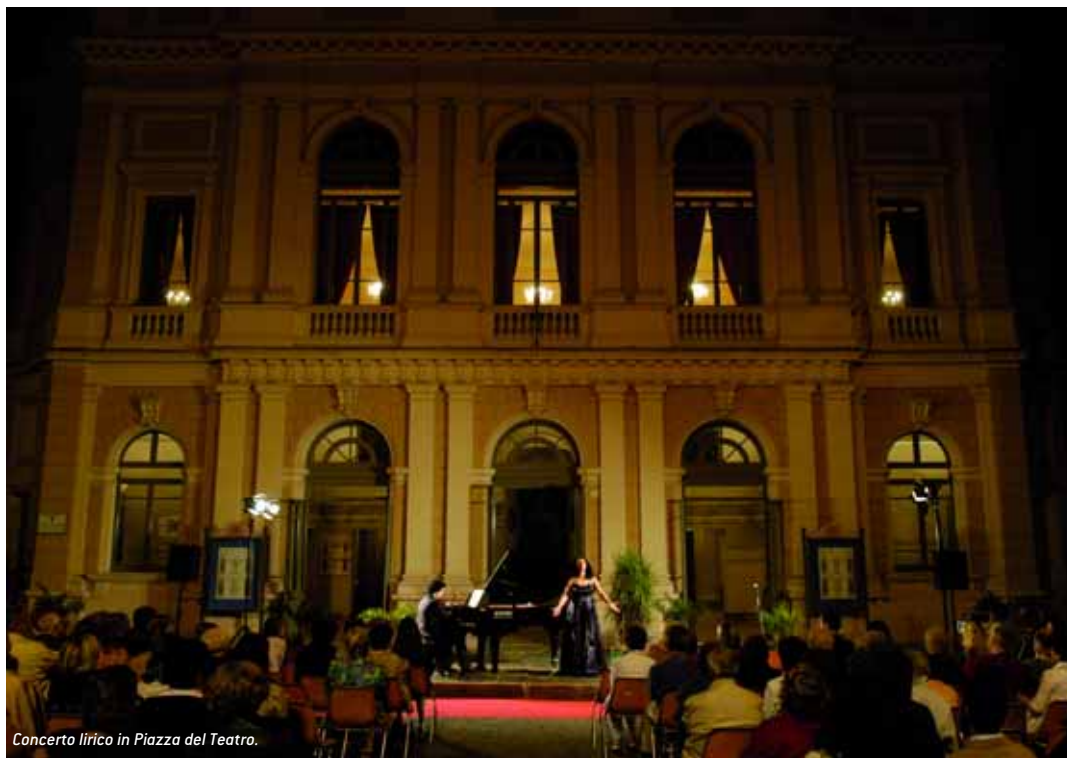
Concerto lirico in Piazza del Teatro.

Gennaio 2006, tempo di bilanci e previsioni. E' l'occasione per riflettere sulle esperienze passate e sulle prospettive future. E' l'occasione anche per riaffermare con forza la volontà di proseguire il cammino intrapreso perseguendo il principio della crescita, in un momento in cui diventa sempre più arduo il compito di allestire una stagione teatrale o di impostare un programma culturale date l'imprevedibilità del mercato, il gusto dello spettatore condizionato dall'offerta televisiva (talvolta discutibile) e, non ultima, una crisi economica che induce le famiglie a ridurre drasticamente le spese.