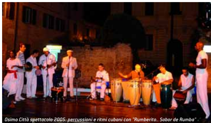
Osimo Città spettacolo 2005: percussioni e ritmi cubani con “Rumberito.. Sabor de Rumba”