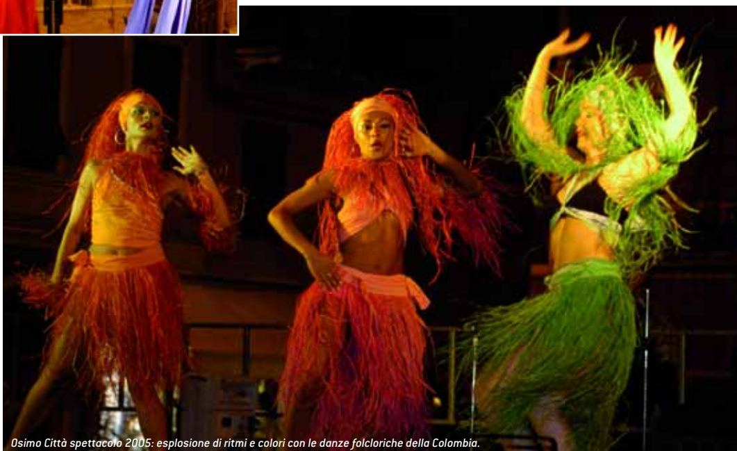
Osimo Città spettacolo 2005: esplosione di ritmi e colori con le danze folcloriche della Colombia.