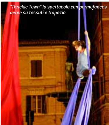
“Thrickle Town” lo spettacolo con perfoances aeree su tessuti e trapezio.

In seguito alla positiva esperienza dell'anno precedente, si è organizzata la II edizione di “Osimo città spettacolo”, che si è arricchita nel 2005 di nuovi contenuti volti a suscitare l'interesse e la curiosità del pubblico. I temi proposti: danza etnica e folclorica, “la notte di pulcinella”, un omaggio al folclore napoletano e il Teatro nuovo circo.