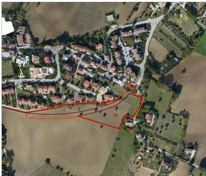
Legenda: ■■■■■ Limite confine comunale - - - - - Limite scheda di assetto [Art. 32 Nta] ——— Limite sottozona di piano [Titolo II Nta]