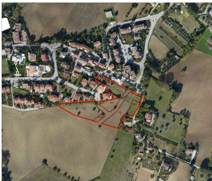
Legenda: ■■■■■ Limite confine comunale - - - - - Limite scheda di assetto [Art. 32 Nta] ——— Limite sottozona di piano [Titolo II Nta]