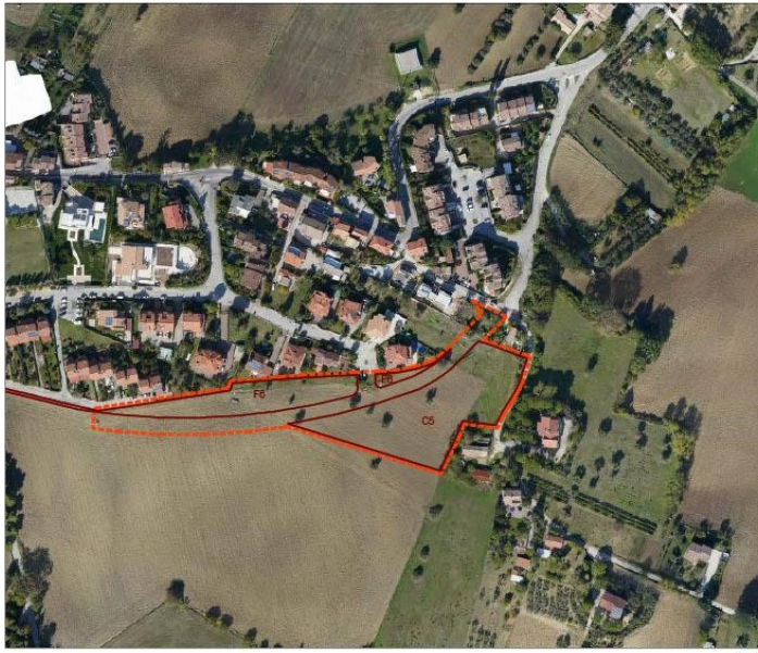
Legenda: ■■■■ Limite confine comunale - - - - Limite scheda di assetto [Art. 32 Nta] — Limite sottozione di piano [Titolo II Nta]