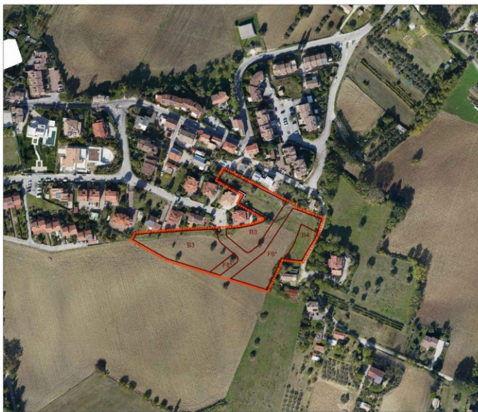
Legenda: ■■■■ Limite confine comunale - - - - Limite scheda di assetto [Art. 32 Nta] — Limite sottozione di piano [Titolo II Nta]