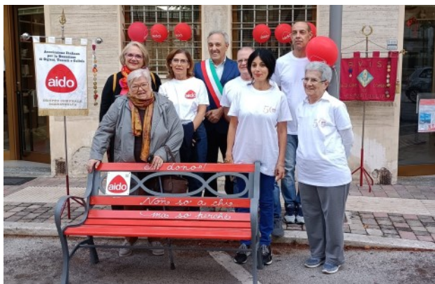
Comune di Esanatoglia

Le panchine del dono vogliono essere un gesto tangibile per ricordare ad ognuno di noi l'importanza del donare per ridare la vita".