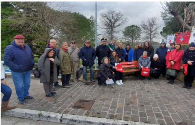
Comune di Porto Recanati