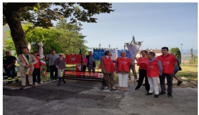
Comune di Pollenza