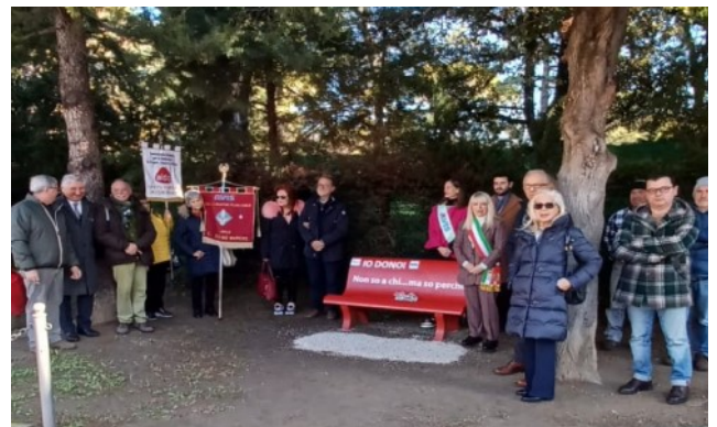
Comune di San Severino