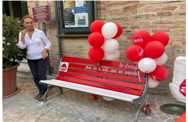
Comune di Porto Civitanova Marche

Alla loro morte gli organi si salvano una o più vite si A.I.D.O. Sensibilizza e promuove la cultura della donazione si Le persone dichiarano la propria volontà e intraprendono stili di vita sani si Vite che rinascono e che possono nuovamente costruire famiglie, lavorare e raccontare la propria esperienza