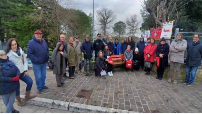
Comune di Sarnano