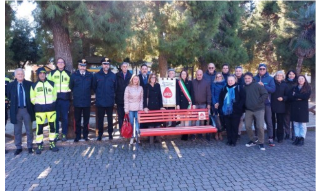
Comune di Porto Potenza Picena