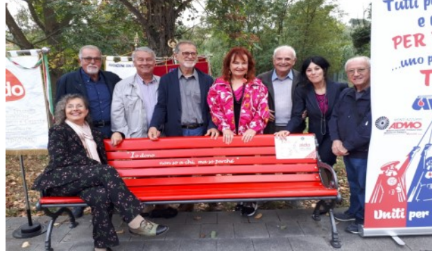
Comune di Tolentino