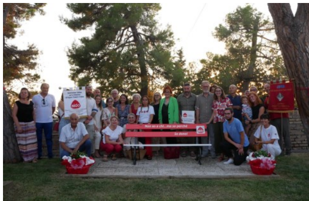
Comune di Montecassiano