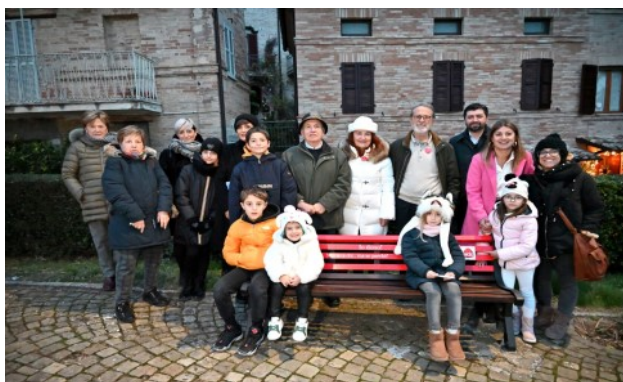
Comune di Petriolo