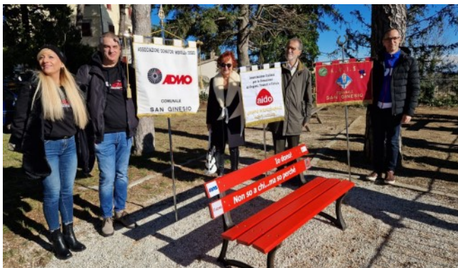
Comune di San Ginesio