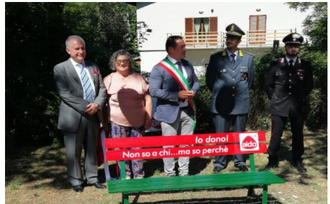
Comune di Pievevitorina