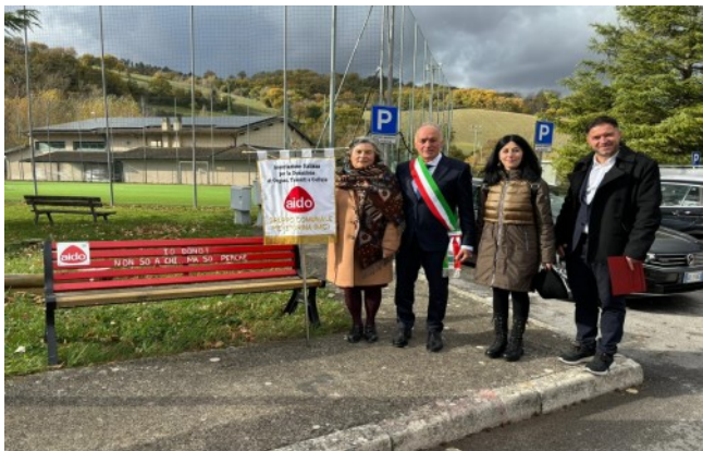
Comune di Valfornace