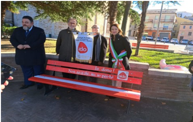
Comune di Potenza Picena