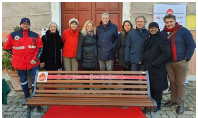
Comune di Montefiore di Recanati