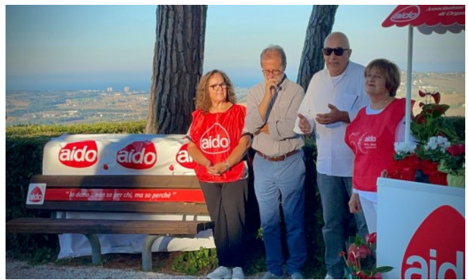
Comune di Montelupone