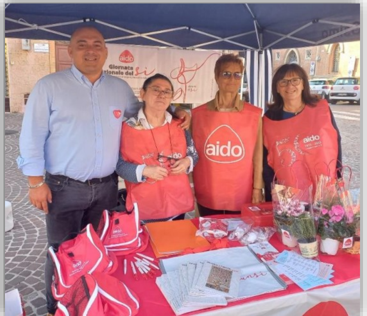
piantina per "dare una speranza agli 8.000 pazienti in attesa di trapianto"

E' stata pure l'occasione per favorire l'autofinanziamento del Gruppo Osimo attraverso l'offerta d'una